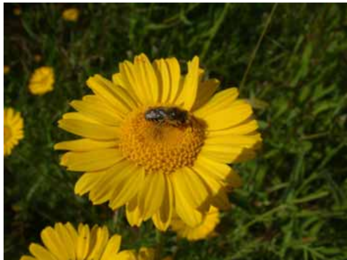
Erste Bewohner der Blumenwiese