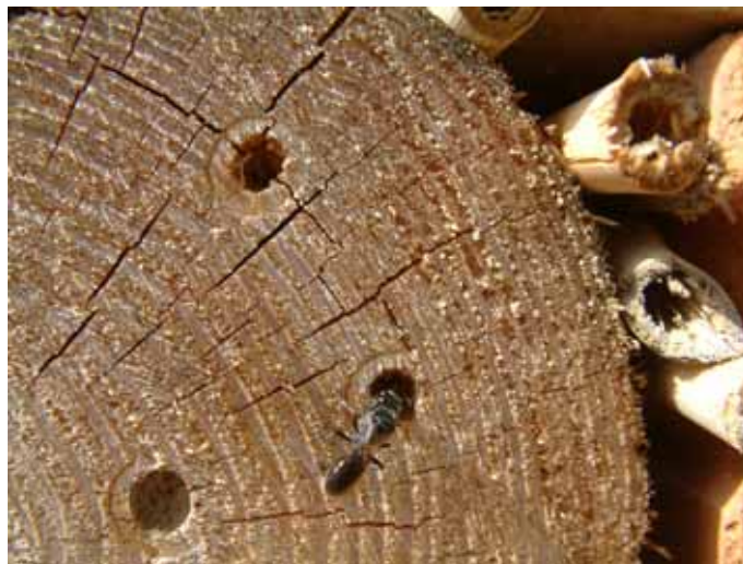
Erste Bewohner des Insektenhotels

Die Ausgestaltung der weiteren Engagementfelder wird hier nur durch Eckpunkte beschrieben: