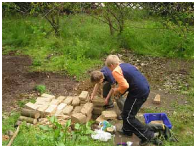
Lehmziegelherstellung und -verlegung durch die Schüler/innen