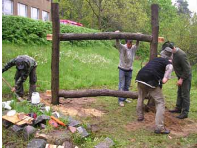
Unterstützung durch Eltern und ältere Schüler/innen

Zwei Studenten der Universität Potsdam haben über den Naturschutzbund gemeinsam mit den Schülern eine „Bienenralley“ entwickelt, bei der man sein Wissen und seine Sinne testen kann. Dieses Lehrmaterial ist im Naturschutzzentrum angesiedelt und kann dort genutzt werden bzw. auf Anfrage ausgeliehen werden. Inzwischen haben wir unsere schuleigene „Bienerallye“ nachgearbeitet und haben damit ständig Zugriff auf diesen Wissensspeicher. Im Frühjahr 2005 ist ein durch Eltern initiiertes Tastpfad zum Insektenhotel aus wechselnden Bereichen mit Steinen, Zapfen und anderen Naturmaterialien gestaltet worden, der mit geschlossenen Augen und barfuß begangen werden soll.