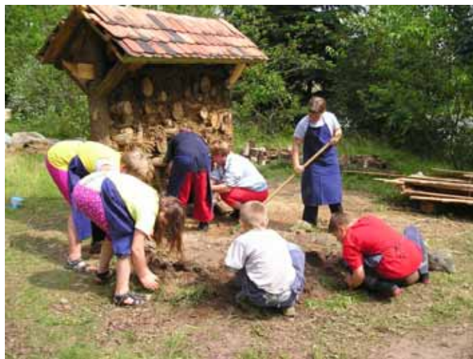
Schüler/innen bauen das Insektenhotel

Zwei Studenten der Universität Potsdam haben über den Naturschutzbund gemeinsam mit den Schülern eine „Bienenralley“ entwickelt, bei der man sein Wissen und seine Sinne testen kann. Dieses Lehrmaterial ist im Naturschutzzentrum angesiedelt und kann dort genutzt werden bzw. auf Anfrage ausgeliehen werden. Inzwischen haben wir unsere schuleigene „Bienerallye“ nachgearbeitet und haben damit ständig Zugriff auf diesen Wissensspeicher. Im Frühjahr 2005 ist ein durch Eltern initiiertes Tastpfad zum Insektenhotel aus wechselnden Bereichen mit Steinen, Zapfen und anderen Naturmaterialien gestaltet worden, der mit geschlossenen Augen und barfuß begangen werden soll.