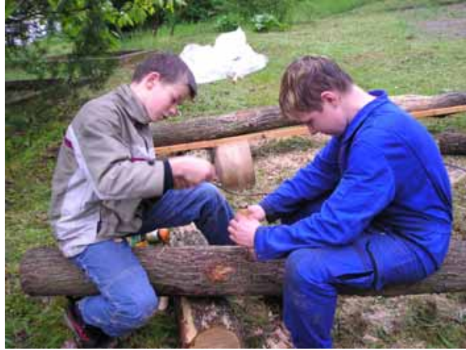
Vorarbeiten für's Insektenhotel

Nach ca. 2-3 Monaten standen die Planungen und wir begannen mit der Umsetzung des Projekts. Dazu gehörten: