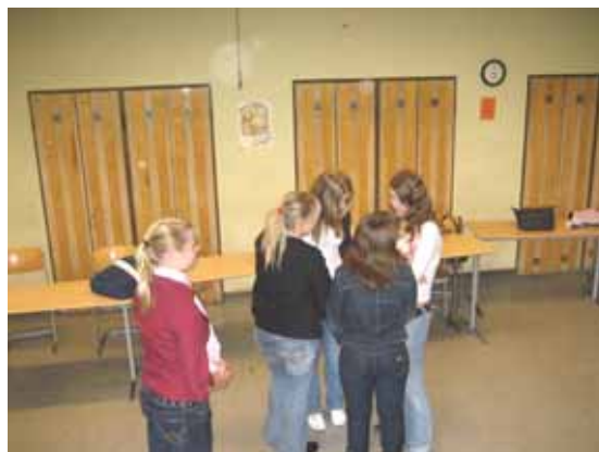
Szene aus der Übung "Kontaktaufnahme"